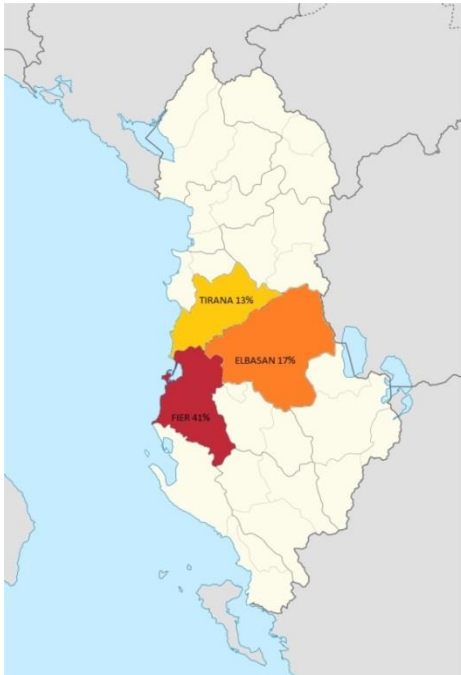
Figura 2 – Prefetture dell’Albania maggiormente interessate dalle indagini familiari